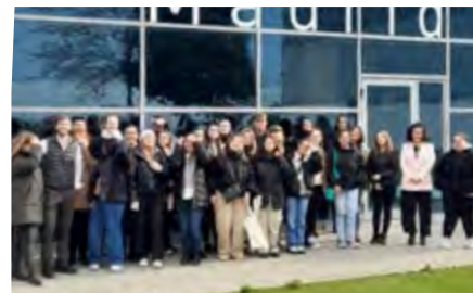
Las Musas Madrid