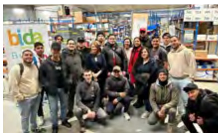
Cruz Roja Burgos

Finalmente, el Colegio La Salle Virgen del Mar de Almería visitó las instalaciones de Bidaforma en la ciudad andaluza, culminando un ciclo de encuentros que no solo han servido para educar sino también para inspirar y formar a los profesionales del mañana.