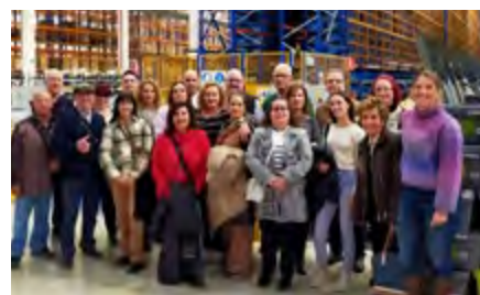
Auxiliares de Farmacia