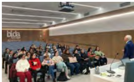
La Salle Almería