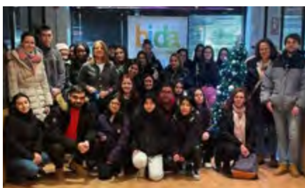
IES Enrique Florez